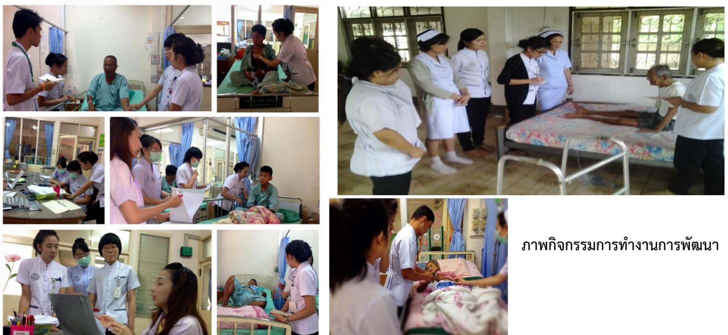
ภาพกิจกรรมการทำงานการพัฒนา